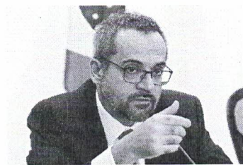
Weintraub recebeu ajuda do Itamaraty para entrar nos EUA